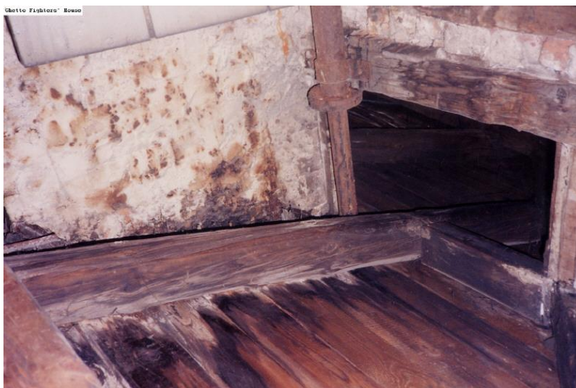
מקום מסתור בגטו רדומסקו.