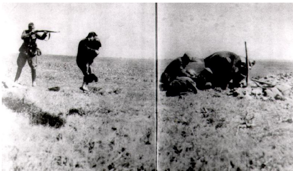
גילוי בונקר בו הסתתרו יהודים, הוצאה להורג של אם ובנה.

במשך כל הלילה הבחנו בתנועות בלתי רגילות בחוץ. המשמרות. הגרמניים שוטטו ברחובות כשליחיו של המוות. הם הילכו בזוגות ואף ביחידות; מגיחים היו מתוך הצל וחשים להעלם מאחורי פינת הרחוב. הם עברו זה ליד זה בשקט, התבוננו בפני חבריהם והמשיכו בסיוורם. כל אחד מהם עצר ליד עמוד הטלפון והביט בגופה. נראה היה שהם הצטערו על עובדת מותו. על שלא היה לאל ידם להתעלל בו עוד ולהמיתו בשנית. אז עמדו והביטו בביתנו וריר נטף - מפייהם. הם הדליקו את פנסיהם והאירו את החלונות. התלחשו ביניהם בהראותם על הבית ואף אל החלון שלידו ישבתי. אחד הזקיפים פרש מהחבורה, נכנס לבית שמנגד ולביתנו ונשאר שם. בהביטי לאחר זמן מה הרחובה ראיתי זקיף היושב על המדרגות המוליכות לביתנו כשרובה מונח בין ברכיו.