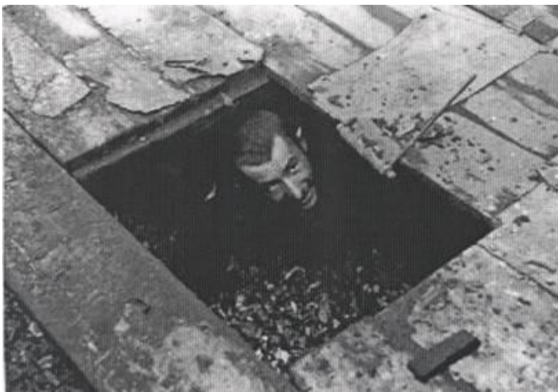
לודג' - פתח מסתור בעליית גג