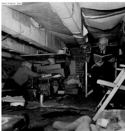
זוג זקנים יהודיים בהולנד במסתור בעליית גג. [ארכיון לוחמי הגטאות]

לך בכורי, לך יחידי, לבל ידעו שאתה יהודי. גם אם נגזר שתחייה בין גויים, העיקר, מחמדי, תישאר בחיים!