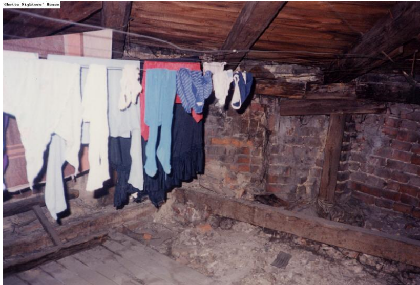
מקום מסתור ליהודים בגטו רדומסקו.