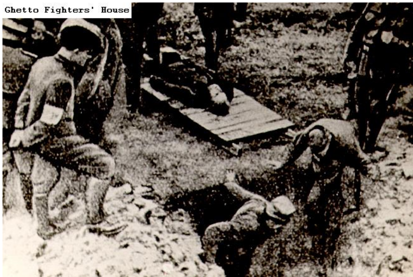
חיילים גרמניים ומשתפי פעולה מגלים בונקר.