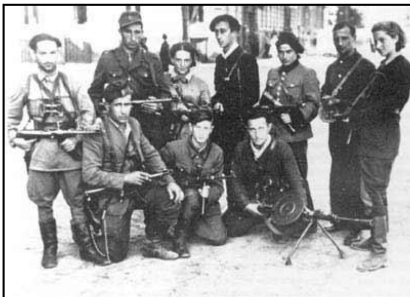
אבא קובנר (במרכז) עם לוחמי גטו וילנה.

הוסבר לנו, שהיא שיננה לה, לתינוקת, 11 חודש שאסור לה לבכות כאשר היא רעבה. כיוון שישמע מישהו בחוץ ויגלו אותן. עכשיו, כאשר היא שמעה את אמה בוכה, היא שאלה את השאלה. אני יכול לספר עוד דברים שראיתי. אבל שאלה זו של ילדה, אפשר אומרת יותר מכל. אם כי אינני יודע אם שאלה תמה זו של תינוקת היא ראייה למשפט.