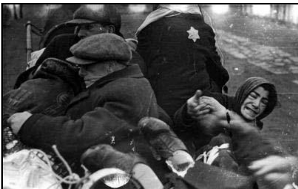
גירוש חולים וזקנים מגטו לודז' לחלמנו. לודז', פולין, 1942

לכל איש יש שם, שנתן לו אלוקים ונתנו לו אביו ואמו. לכל איש יש שם, שנתנו לו קומתו ואופן חיכו ונתן לו האריג. לכל איש יש שם, שנתנו לו ההרים ונתנו לו כתליו. לכל איש יש שם, שנתנו לו המזלות ונתנו לו שכניו. לכל איש יש שם, שנתנו לו חטאיו ונתנה לו כמיהתו. לכל איש יש שם, שנתנו לו שונאיו ונתנה לו אהבתו. לכל איש יש שם, שנתנו לו חגיו ונתנה לו מלאכתו. לכל איש יש שם, שנתנו לו תקופות השנה ונתן לו עיוורונו. לכל איש יש שם, שנתן לו הים ונתן לו מותו.