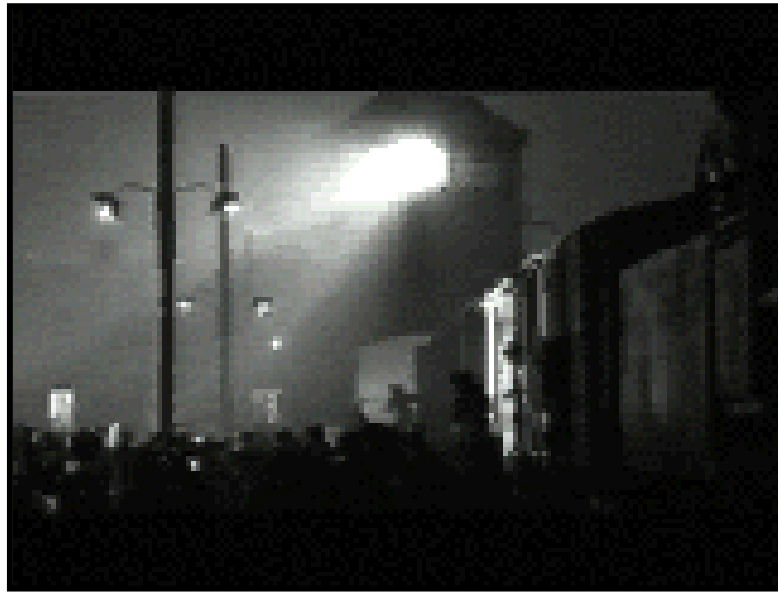
רכבת המוות מגיעה בלילה למחנה השמדה