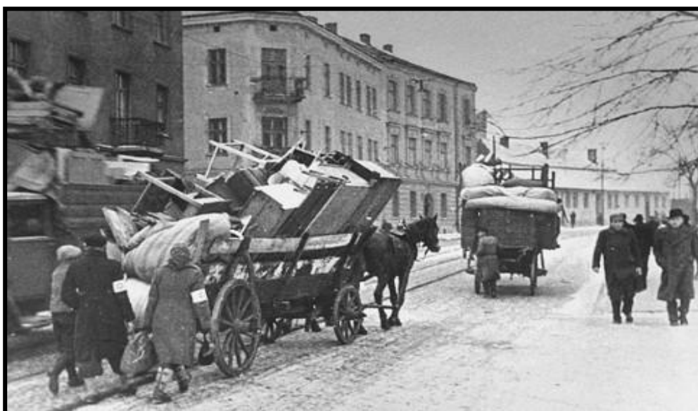
היהודים בקרקוב מועברים לגטו

בקול רפה, שנשמע אך בקושי השיבה: - את אלוקים חייבים אנו לשבח בכל מקום ובכל הזמנים. אלוקים מקשיב לתפילתנו, גם כשהיא נישאת ממעמקים. ואם אפילו לא יבוא לעזרתנו, הרי ישנם עוד יהודים בעולם, שלמענם אנו חייבים לבקש שבוע טוב. שאלתיה כיצד ידעה כי שבת היום. היא ענתה לי, שהגיעה לכאן לפני מספר שבועות. עם אחד הטרנספורטים מהונגריה, היא שמרה על מנין הימים ומדי צאת השבת עשתה קשר בשמלתה המרופטת. אמרתי לה שבשבת הבאה אבוא אליה ונתפלל יחדיו. כעבור שבוע ימים נגשתי לאותו מקום, טיפסתי ועליתי לקומה השלישית, קול המלל שלה אל אלוקי אברהם נשתתק לנצח... במקומה שכבה כבר אישה אחרת... (ברטה פרדרבר-זלץ: "והשמש זרחה", עמ' 107-105)