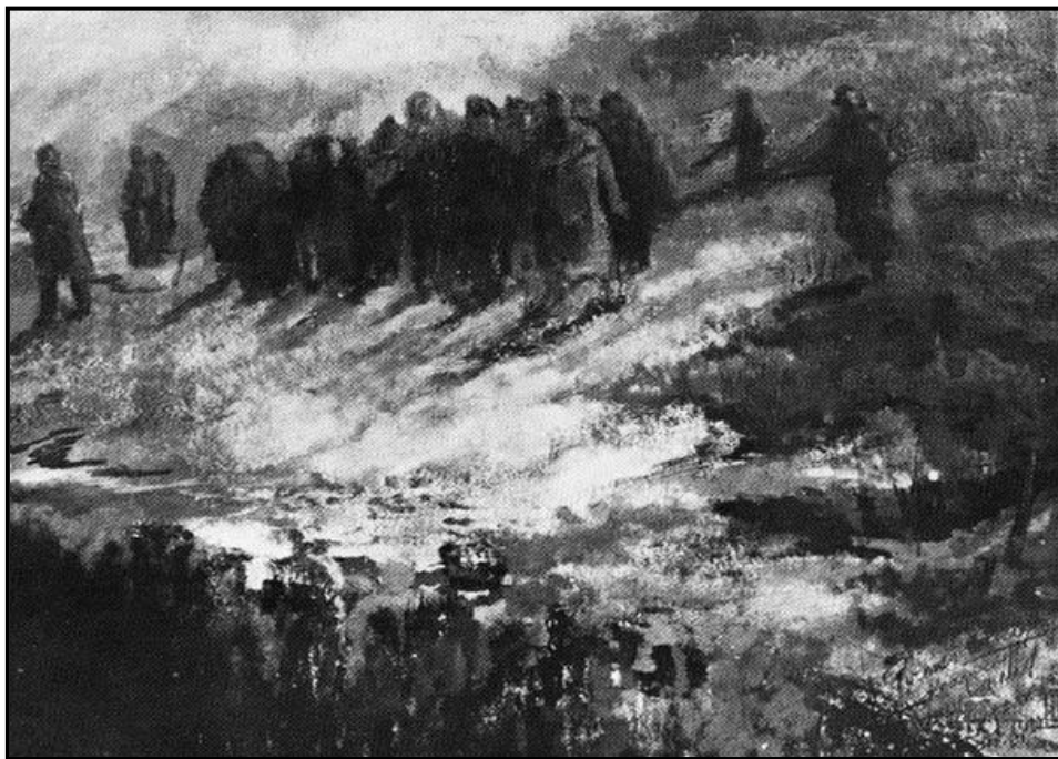
פונאר - צייר: ל.מרגאשילסקי

סיום קטעי עדותו של אבא קובנר [מקור העדות: פרוטוקולים ממשפט אייכמן באתר סנונית.]