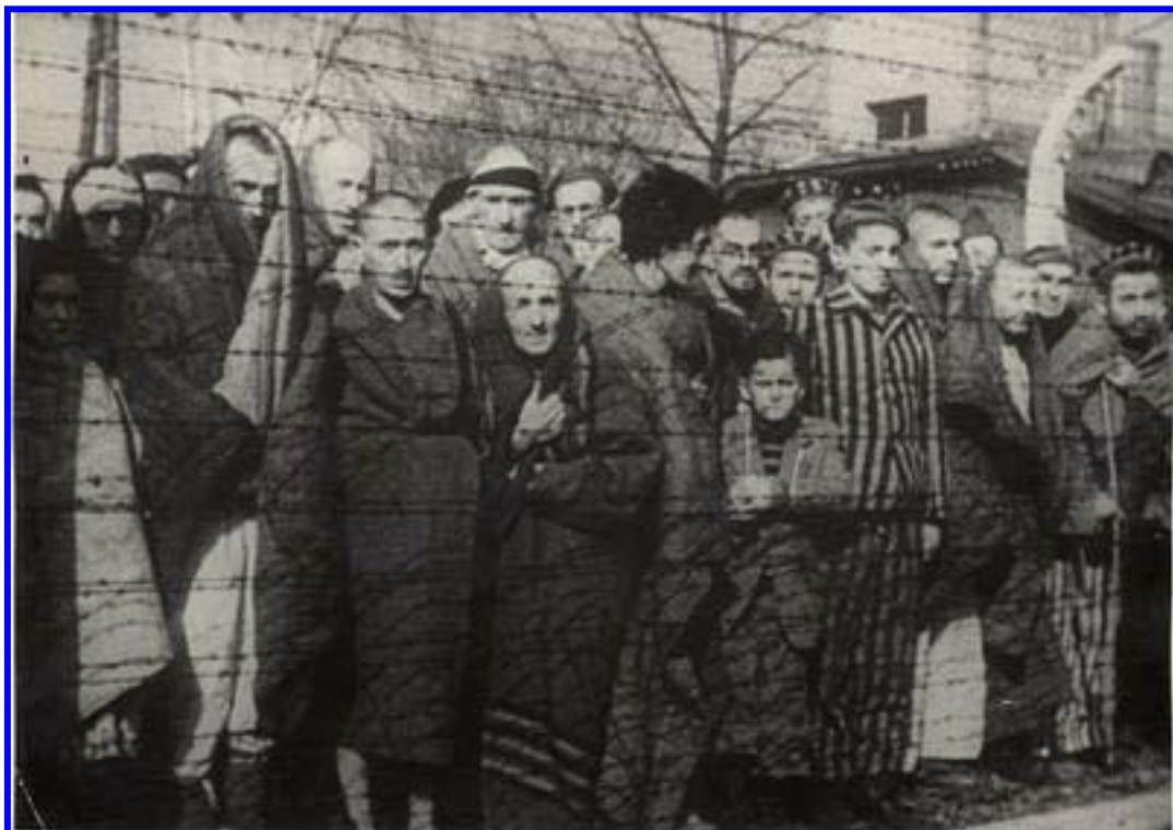
אסירים ליד גדר תיל, אושוויץ, בעת השחרור