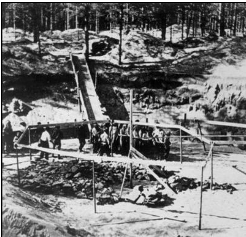
יהודים בדרכם לבורות המוות בפונאר

הוא פקד עליה ושאל: "הי, האם אינך רוצה לחיות, את כל כך יפה, אני אומר לך צעדי צעד קדימה". אז היא צעדה צעד קדימה. הוא אמר לה: "חבל יופי כזה לטמון באדמה. לכי, אבל אל תביטי אחורנית. הנה שדרה. את מכירה את השדרה, לכי." היא רק היססה והתחילה ללכת. השאר - סיפרה לי שרה מנקס - הבטנו בה כאשר עינינו, אינני יודעת אם רק פחד או רק קנאה. היא צעדה, צעד רופף. אז הוא הקצין שלף את האקדח וירה בה ראשונה בגב. ולמה לספר יותר?