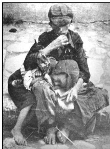
סבלם של ילדים רעבים בגטו

בני עמנו לא המתינו ליום הקדיש הכללי. יש בידינו עדויות, שיהודים התפללו את תפילת הקדיש עוד בתוככי התופת. הקדיש הוא ביטוי נעלה לאמונתנו הצרופה בקב"ה. ד"ר מאיר דבורז'צקי: בספרו "מחנות היהודים באסטוניה", מספר לנו על חבורת אומרי הקדיש במחנות: "עם הפטירות הראשונות ה'מוזולמאנים' (אסירים חלשים הנוטים למות), כאשר שלטונות המחנה התחילו להוציא את הגויות ליער הקרוב לשם שריפתן. התארגנה במחנה קבוצה של 'קדיש-זאגער' (אומרי קדיש), הקבוצה הייתה מתגנבת בחשאי עם לילה, אל גופתו של האסיר שנפטר, והיו אומרים 'קדיש' אחריו, בטרם תישלח הגופה לשריפה. בין אומרי הקדיש היו יהודים ו'סתם יהודים'. אמירת 'קדיש' זו בלילה, הייתה כרוכה בסכנה גדולה. אולם אלו שסיכנו את עצמם היו נוהגים לומר: אם אין לנו אפשרות לשמור על כבודו של האסיר החי – אל נמנע מן האסיר המת את כבודו האחרון".