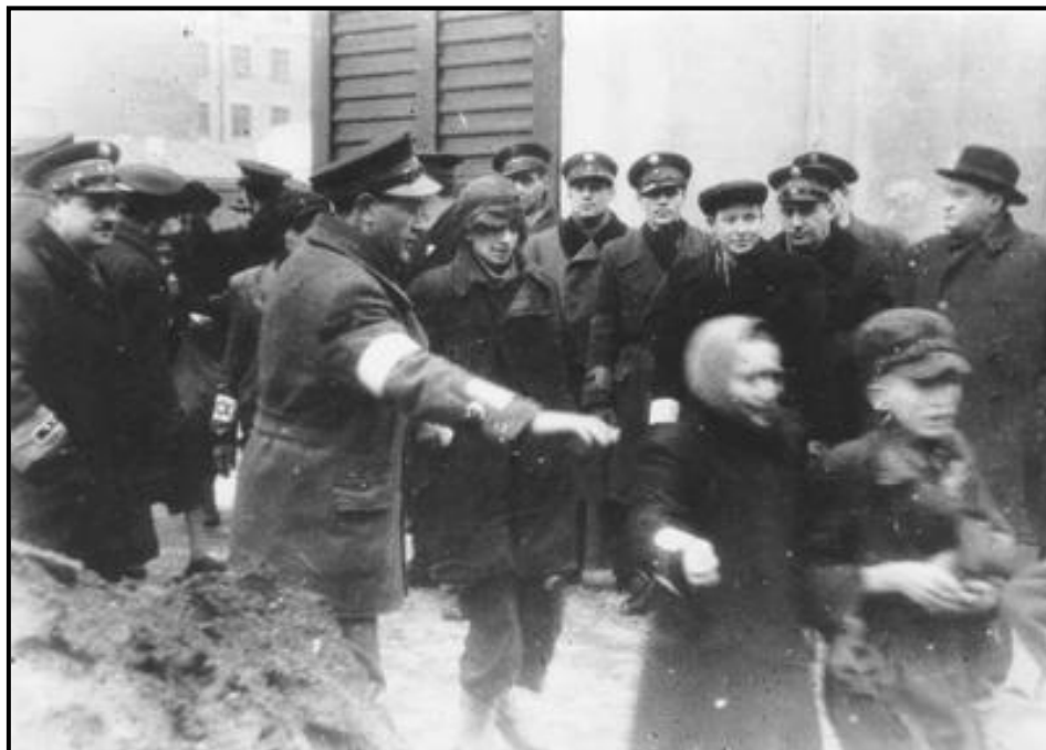
ילדים יהודים מגטו ורשה מגורשים לטרבלינקה, ורשה, פולין