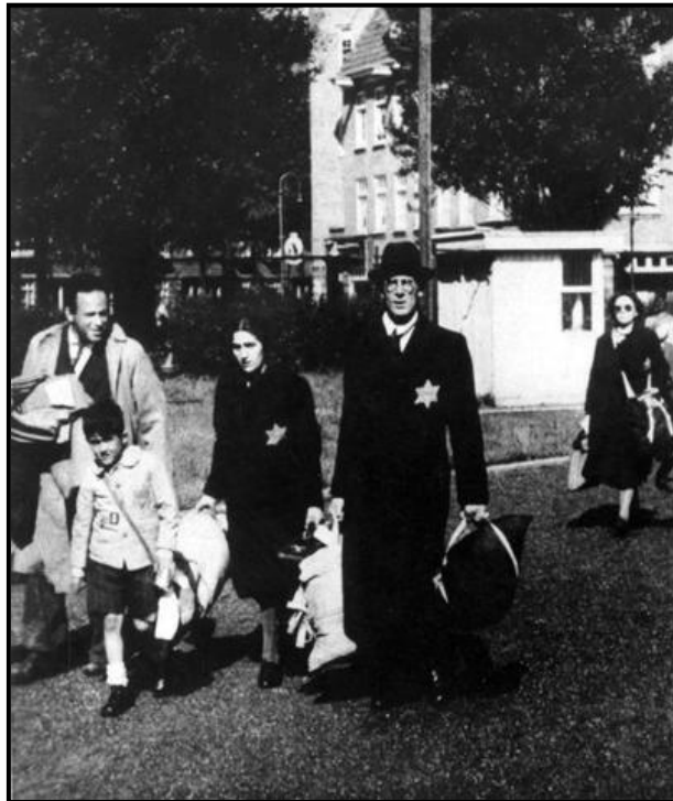
גירוש יהודי אמסטרדם

אש תוקד בקרבי / בהעלות על רוחי / חרבן עדתי קינים אגידה / בזכרי קדושי / ערבה שמחתי קהילות קודש / לומדי תורתי / מחזיקים בבריתי נחרבו ונשרפו / נחנקו ונהרגו / אוי לי כי חטאתי כזבחים וכעולות / עלו מזבחה / לכפר משובתי בני ציון היקרים / בחורי חמד / לומדי תורתי גולת אירופא / מקום אבותיי ורבותי / הבאר שכריתי נהפך לדם ואש / מקורי דמעה / אהה כי נדמיתי איכה נשמדו / לעיני בני עמי / אבדה תקוותי אלפי רבבות עלו על מוקדה / מי ייתן תמורת חתנים וכלות / זקנים וזקנות / מי ייתן חליפתי הישמר לך / פן תשכח מעש עמלק / מחריב כנסתי עדי ינקום ה' / נקמת עמו / יבנה את ביתי אנא ה' נקם / נקמת עבדיך / והשב את שבותי יקומו מתיך / ויחיון צדיקיך / ואז אסיר אבלתי