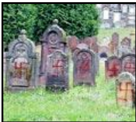
צלבי קרס על מצבות בבית הקברות בפריז