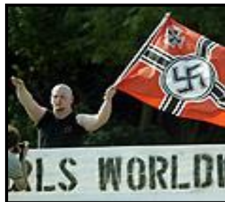
כינוס ניאו-נאצים בארה"ב