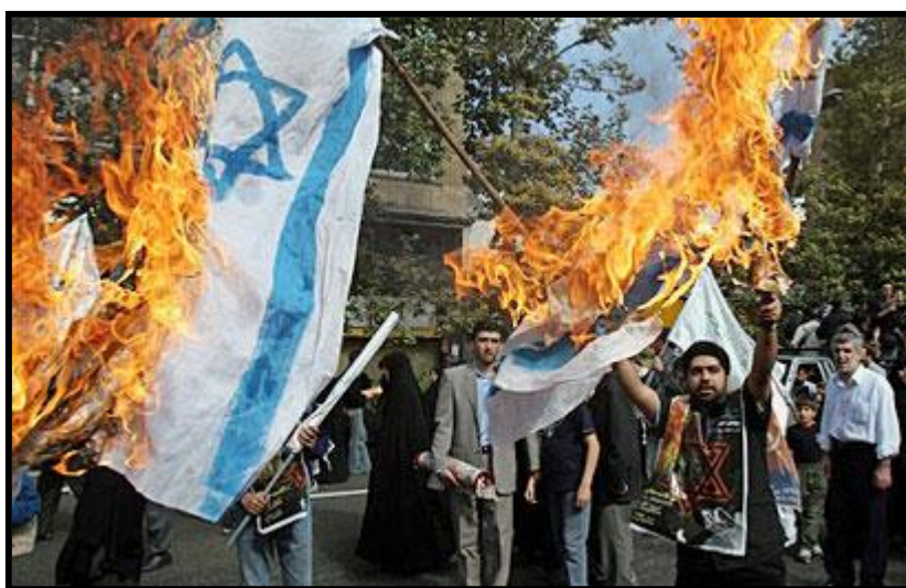
מפגינים באיראן נגד ישראל