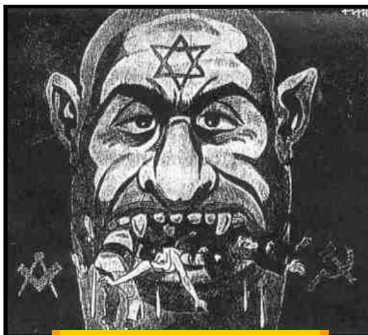
קריקטורה: היהודי הטורף

ההרגשה תחילה הייתה, בקרב היהודים ובמידה לא קטנה גם בקרב אומות העולם, שתולדות האנטישמיות כבר נסתיימו. כה רבה הייתה זוועת מעשיהם של הנאצים, שכל אדם בעל הרגשה אנושית צריך היה לכאורה להירתע בפני תופעות מסוג זה להבא ולצאת חוצץ נגד תנועה העלולה להולידן; ונוסף על כך הרי הוכרז לא פעם על ידי מעצמות ההסכם וע"י העמים שנלוו להן שאחד התפקידים העיקריים, עבורם הם נלחמים הוא להקים משטר בעולם בו לא יהיה מקום לתנועת שטנה ולשעבוד האדם על חטא מוצאו או אמונתו.