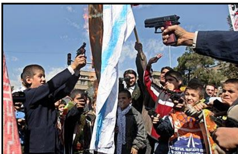
תהלוכת "יום ירושלים" באיראן