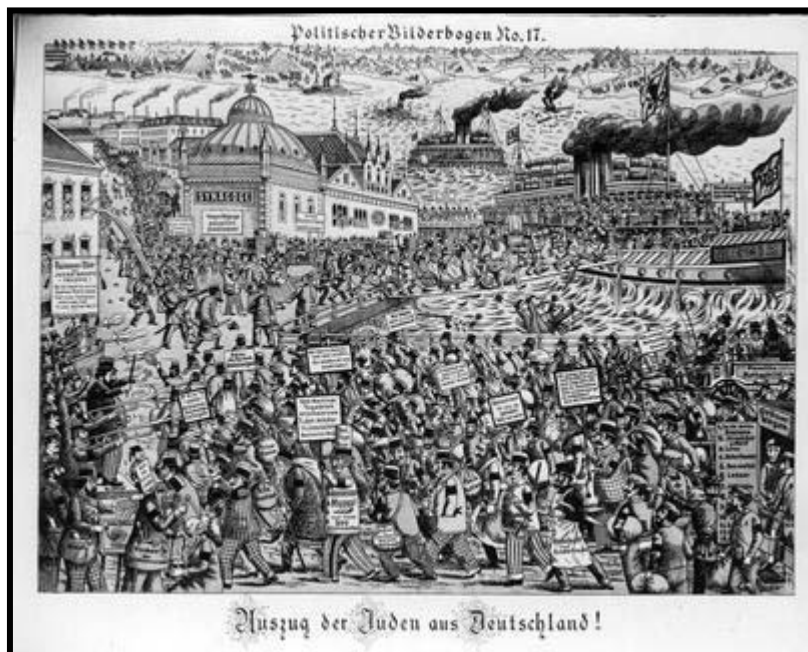
קריקטורה: 'יציאת היהודים מגרמניה' [מארכיון יד ושם]

נפסק גם הקשר בין גורמים חיצוניים לבין מתיחות אנטישמית. הורגלנו בשנים ובדורות הקודמים שתעמולת השטנה גדלה בתקופה של קושי כלכלי או מדיני, ואילו בתקופות רגילות היא יורדת בהרבה. לא כן היום. השעבוד המדיני פסק במידה רבה עם מיגור הפשיזם והנאציזם במלחמת העולם, ועם המאבק לשחרור המושבות (תהליך ה"דיקלונזציה") שהתחיל מיד לאחר כך; גם המצב הכלכלי בעולם נשתפר בהרבה אחרי המלחמה, והעוני ההמוני, בעיקר בארצות מזרח-אירופה ששימש קרקע פורייה לתעמולת שטנה בשנים הקודמות, כמעט ונעלם. האנטישמיות היום חודרת אפוא לחוגים רחבים של האוכלוסייה כאילו ללא סיבה של ממש. תוך כדי כך לא קל גם להסביר אופיה. החלוקה לסוגים שונים של אנטישמיות שעליה דובר לעיל, אין לה מקום בימינו. אין בודאי לדבר - פרט למקרים בודדים - על אנטישמיות דתית, כי כאמור הכנסיות הדתיות עצמן נתגייסו למלחמה בה; אין לדבר כמו כן על אנטישמיות כלכלית או לאומית במובנה הרגיל או הגזעי. משהו מכל הסוגים מבצבץ פה ושם, אולם לא הוא העיקר; התופעה במהותה היא מסוג אחר שטרם נודע בשנים הקודמות.