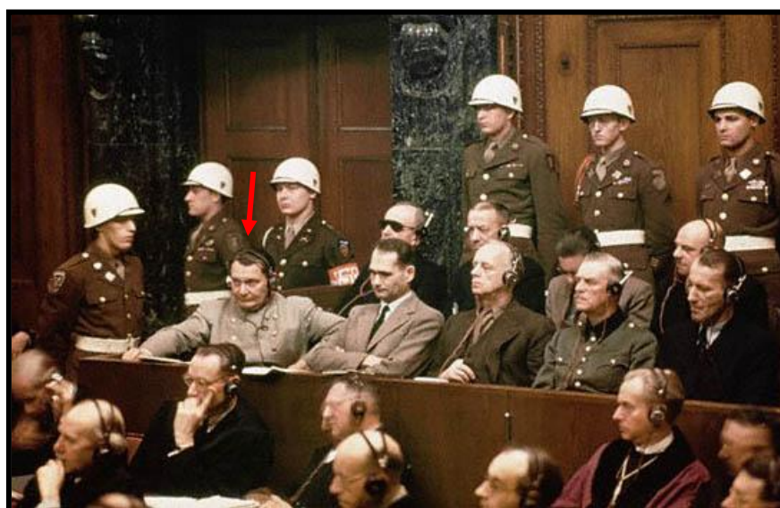
נאשמי המשפט שימו לב לשיבתו היהירה והמזלזלת של גרינג