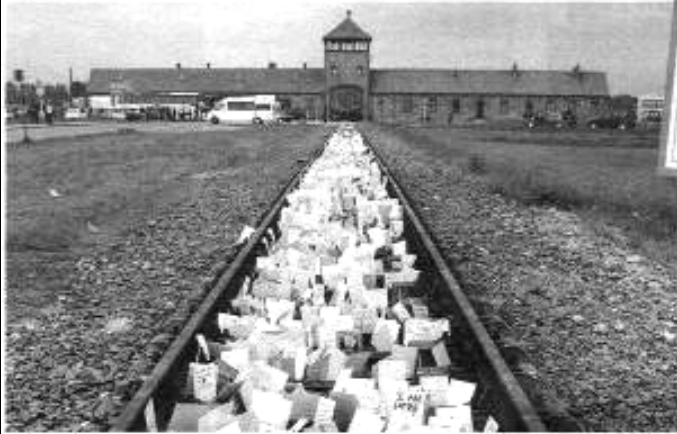
מתקנים על המסילה במחנה בירקנאק. יש צורה אחת של שוואה - סיפור הכיכרית הימני

"הפולמוס", קובץ החמרים בעקבות "נוטות החסד", מוכיח כי הדילמה לגבי כתיבת שואה נותרה בלתי פתורה • כן, גם אחרי רומן מונומנטלי שהצליח להתמודד עם המורכבות של המלחמה